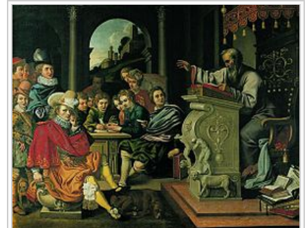
Pintura que ilustra la Retórica, una de las siete artes independientes, de Pieter Isaacs.