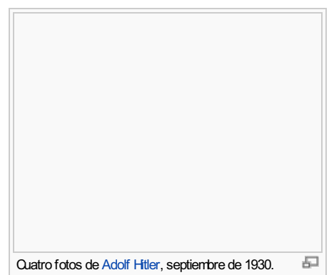
Cuatro fotos de Adolf Hitler , septiembre de 1930.