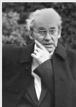
« La historia de la retórica es la historia de la "peau de chagrin" ("piel de zapa") », 5 6 cita de Paul Ricoeur en La Métaphore vive, pág. 13.