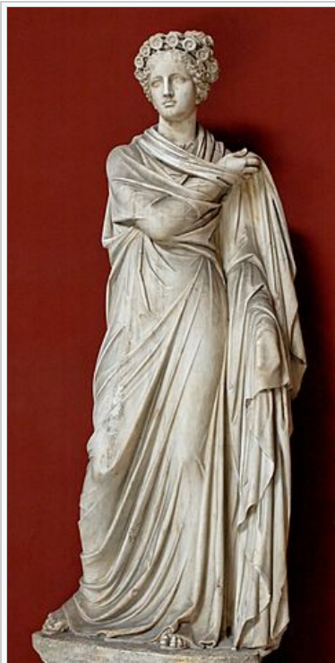
Polimnia, musa de la poesía-lírica-sacra, obra romana en mármol del siglo II.