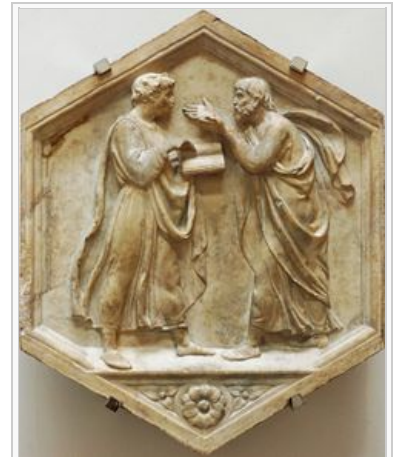
"Platón y Aristóteles" o la « filosofía ». Tablero de mármol que proviene de la fachada norte, registro inferior, del Campanile de Florencia. 8

El tercer género retórico que se desarrolló en Atenas fue el epidíctico que abarca los discursos que tienen lugar en ocasiones especiales, por ejemplo, en un funeral y cuyo principal objetivo es reforzar los valores de una comunidad. El discurso Epidíctico más importante de la Atenas Clásica es el Discurso Fúnebre de Pericles .